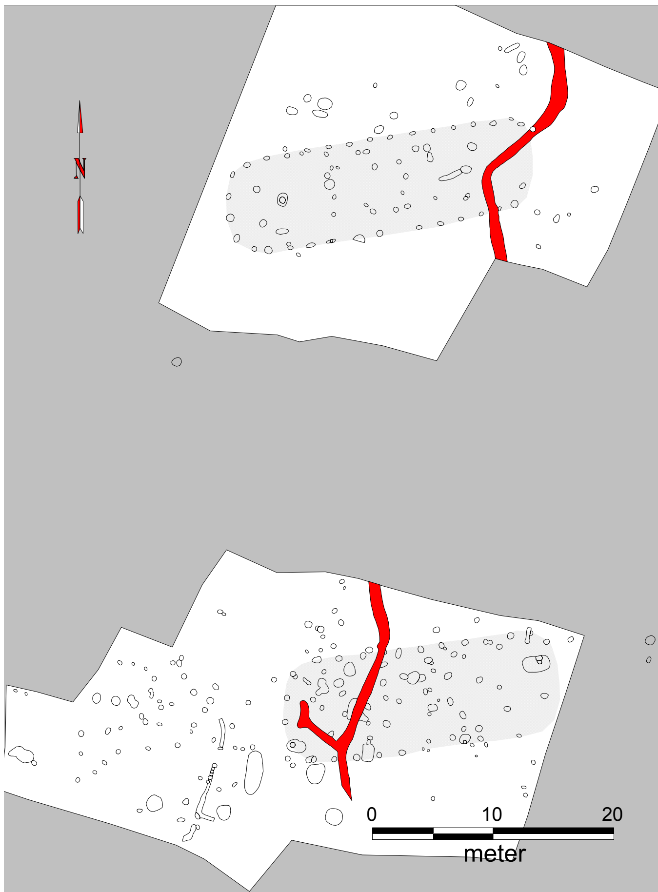
Oversigtplan over den systematiske udgravning HBV 1262 Roved I. De gråskraverede områder markerer omridsene af de to fremkomne huse fra bronzealderen. De røde områder markerer pansergravssystemet fra 1944-1945.