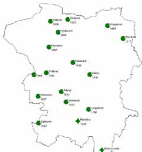
Figur 5. Stednavne med skovindikerende stednavne, samt Rødding.

Det samme kunne gælde for de 17 navne, der har at gøre med rydning af skov. Disse navne viser ikke skovens udbredelse i Vejen Kommune, men hvor der er hugget skov om