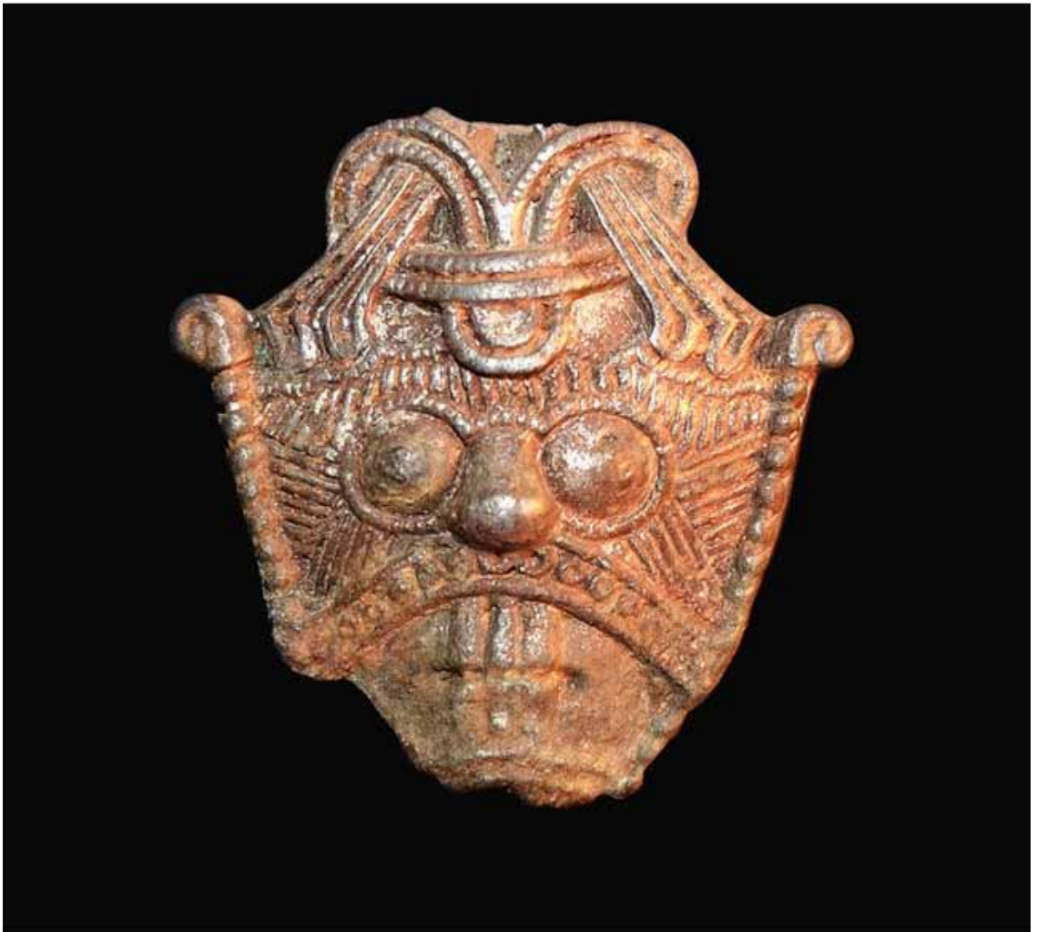
Figur 1. Lokemasken fra Øster Lindet. Bemærk de tre lodrette syninger, som ligger hen over mundpartiet.

således også i fortællingen Skjaldskabslæren, som kan læses i Snorre Sturlasons Yngre Edda. Fortællingen indledes da Loke havde forårsaget, at Thors Kone Sif mistede hele sin hårpragt. En niddingsdåd der gjorde Thor så vred, at Loke måtte love Sif en ny hårpragt af guld, der kunne vokse på hendes hoved. Håret skulle to dværge, Ivaldisønnerne, smede. Foruden guldhåret lavede de to brødre også Balders