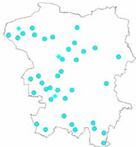
Figur 4. Stednavne med -torp, -bøl og -by i Vejen Kommune.

temmelig tomt i de sandede områder mod nordvest, og de gamle skovområder i sydøst. Netop i forbindelse med skovenes historie er det dog interessant, at selvom stednavneforskerne tolker Rødding som et rydningsnavn, og altså ikke et gammelt -ing navn, så er der faktisk gjort bopladsfund fra det meste af jernalderen i den nordlige ende af byen, i en udgravning, som blev lavet af vore kolleger i Haderslev i 2003 (Bakkegården Øst).