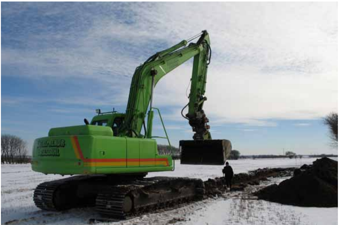
Museets arkæologer bruger helt andet udstyr, og finder meget sjældent genstande som masken fra Øster Lindet. Vi er glade for det gode samarbejde med detektorførerne.

Skatten fra Østermarie. Nationalmuseets arbejdsmark 2013. København.