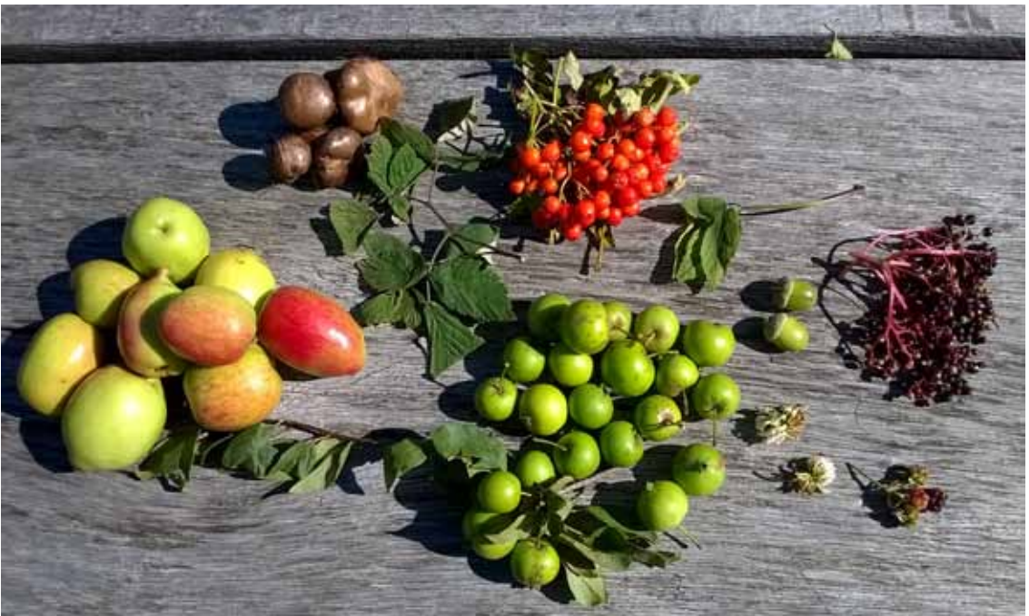
Naturen har adskillige lækkerier at byde på. Naturvejlederen på Sønderskov deltager i et fælles projekt mellem 50 naturvejledere og nogle af verdens bedste kokke for at skabe bedre mad.

På Museet på Sønderskov går vi så småt i gang i efteråret 2016, hvor der bliver lavet sankekurser og lavet mad over bålet. Det er ikke noget nyt. Det nye er måden at tilberede maden på, og at der nu tænkes over udseendet, smagskompositioner i maden, og hvordan det hele serveres.