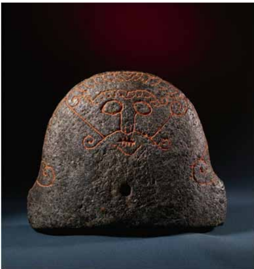
Figur 2. Snaptunstenen fra Horsens Fjordområdet, som viser nærmest identiske ikonografiske træk.

Maskeformede hængesmykker lignende Øster Lindet smykket kendes bedst fra Gnezdovo i det nuværende Rusland, mens en række danske og svenske fund viser enkelte stilmæssige ligheder med masken fra Øster Lindet. Blandt de skandinaviske fund bør især fremhæves en svensk gravfunden maske fra Härads-Kumla i Södermanland (figur 3), som også synes at vise lodrette streger over læberne. Ingen af de øvrige fund er dog helt lig dette sydjyske eksemplar, som især skiller dig ud ved den detaljerigdom, der udfylder alle tomme flader på ansigtet. En tidlig Horror Vacui om man vil.