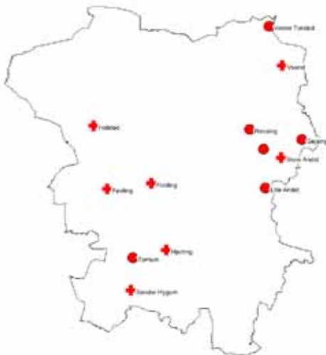
Figur 3. De ældste daterbare stednavne (-um, -sted og -ing) fra Vejen Kommune. Kirker er vist med kors.

Spedningsmønsteret er interessant, fordi især torperne længe har været tolket som udflyt-