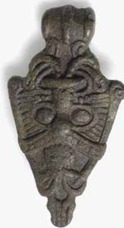
Figur 3. Masken fra Härads-Kumla, som vel er det smykke, der bedst ligner fundet fra Øster Lindet.