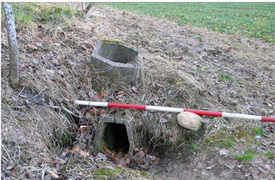
I to fredede gravhøje er der nedgravet kunstige rævegeange.

blev arbejdsgangen en rutine og en række jagttagelser blev gennemført ved hvert enkelt fortidsminde. Fortidsmindets placering i landskabet blev kontrolleret ved indmåling med GPS.