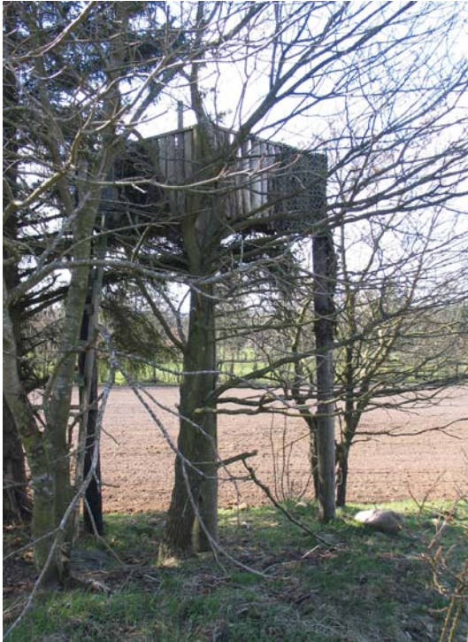
Et jagttårn er opsat på siden af en fredet gravhøj.

blev arbejdsgangen en rutine og en række jagttagelser blev gennemført ved hvert enkelt fortidsminde. Fortidsmindets placering i landskabet blev kontrolleret ved indmåling med GPS.