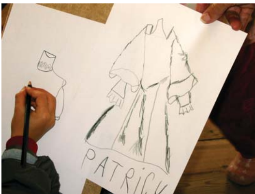
Der blev tegnet rigtig mange flotte tegninger.

Inde i skolestuen var frøken Skrap klar med blæk og pen. Her skulle børnene prøve at skrive med gammeldags pen og blæk. Nogle prøvede endda at skrive med en fjerpen. Det var svært, men efter lidt øvelse gik det helt godt. Det hele skulle ende med et brev, som blev luk-