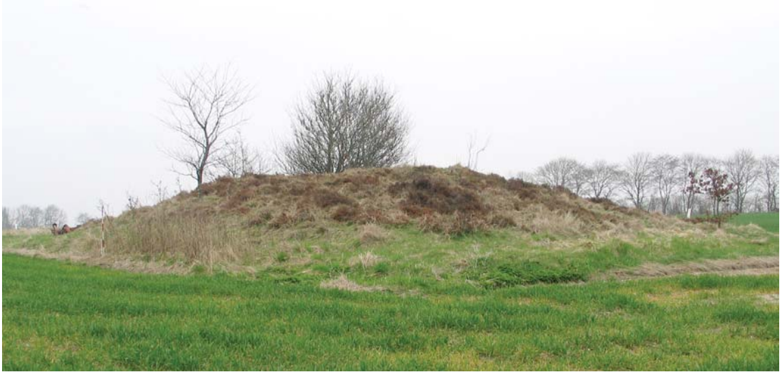
Eksempel på lyngklædt fredet gravhøj i ager.

han Skjoldborg og Johannes V. Jensen, gennemført en egentlig Fredningslov. Lovens essens var, at alle synlige fortidsminder fra 1937 var fredede ved lov. Fra 1937 igangsattes endnu en herredsberedning, der nu havde til formål at klarlægge, hvilke af de tidligere registrerede fortidsminder, der kunne fredlyses ved tinglysning. Når et fortidsminde skal vurderes til fredning, har det vigtigste element altid været fortidsmindets mo-