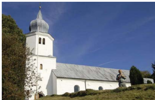
Udflugtens første stop var Nørre Galten Kirke.