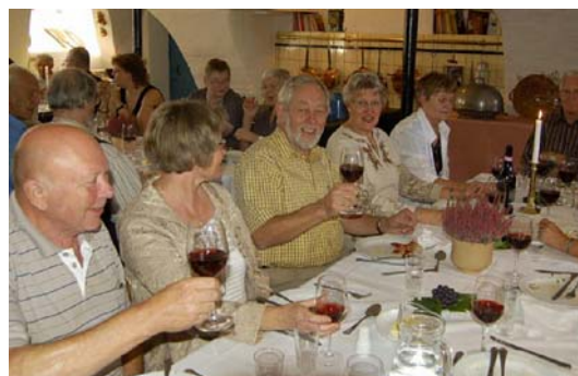
Udflugtens ca. 50 deltagere blev inviteret ned i kælderetagen til et overdådigt frokostbord.