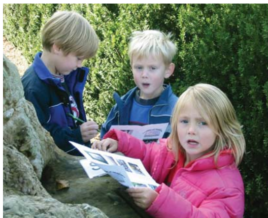
Unge deltagere i opgaveløbet.

Ude på gårdspladsen havde Sønderkovs smedegruppe tændt op i feltessen og viste folk, hvordan en hestesko bliver smedet. Børnene kunne prøve at hamre på det gloende hede jern. Ved siden af smedene var tømmerlauget i gang. Her skulle børnene finde de store armmuskler frem, for her skulle laves dyvler af egetræ. Træet var kløvet i mindre stykker, og skulle hamres igennem