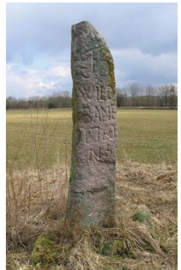
Viltbanestenen på Gravhøj ved Drostrup.