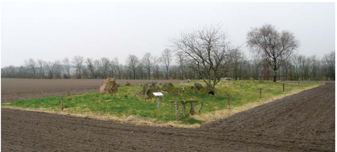
En langdysse med offentlig adgang. Landdysse plejes som en af få udvalgte af Ribe amt.

I 1937 blev der endelig, efter stort pres fra landets lokale fredningsnævn og førende kulturpersonligheder såsom Jo-