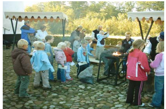
I et hjørne af Sønderskovs borggård lå smede- og tømrerværkstederne.