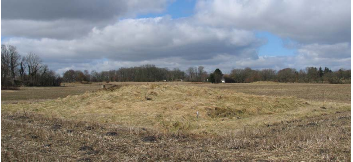
Eksempel på mindre fredet gravhøj sydvest for Brørup, hvor 2 m zonen er markeret med hegnsplæle og der holdes god afstand til gravhøjen.

Der er også rigtig gode eksempler på lodsejere, der ligefrem med hegnsplæle har markeret 2 meter zonen omkring gravhøje og tydeligvis sætter en ære i at passe på „deres“ fortidsminder.