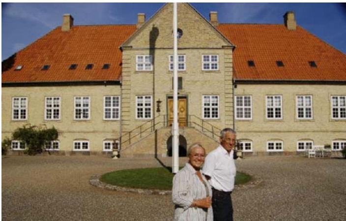
Faursskov Hovedgård's statelige hovedbygning blev opført i 1750 i gule sten.