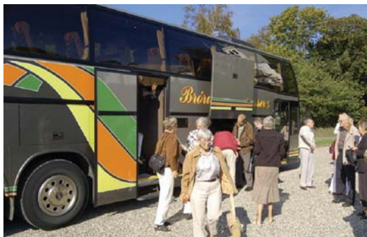
Transporten ved årets kustodeudflugt sørgede Brørup Busser for.