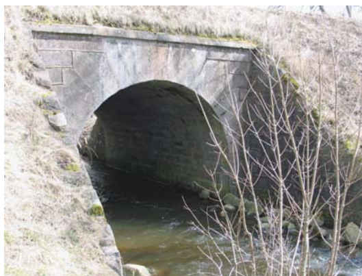
Hesselvad Bro ved Åkjær Å.

I Ribe amt er der tale om ca. 1700 fredede fortidsminder, hvoraf de ca. 220 er beliggende i Holsted, Brørup og Vejen kommuner. Det er hovedsagelig gravhøje fra bondestenalder og bronzealder, der er fredet. Kun en ganske lille del er andre monumenter/anlægstyper som Runesten (Læborg, Bække og Klebæk Høje), Viltbanesten (Stagelundgård, Drostrup, Andst Bro.), Ringvold (Trælborg ved Veerst), Hesselvad Bro ved Åkjær Å, et areal med hærvejsspor, samt