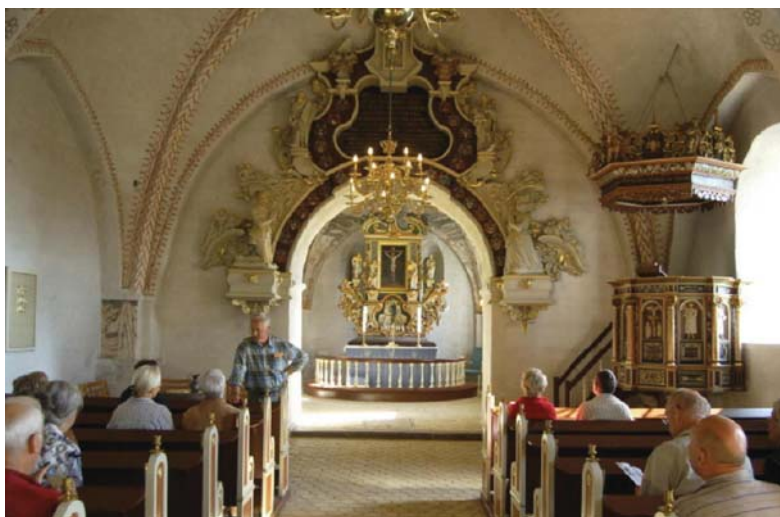
Ægteparret Juels mest markante minde er deres epitafium, der hænger over kirkens korbue.