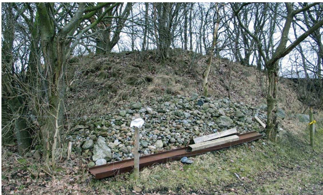
Fredet gravhøj brugt til benkastning af marksten, jernbjælke m.m.

Specielt er gravhøje i skovarealer godt beskyttet. De eneste skader i skovene er som regel følger af stormfald og deraf følgende oprydning. Der er ingen eksempler på tilplantning af fredede gravhøje og forholdene omkring de fredede gravhøje er helt i orden i områdets skove.