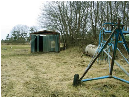
Skur og diverse landbrugsredskaber er placeret op ad fredet gravhøj.

nære områder eller ved fortidsminder tæt på landbrugsejendomme, det kniber med overholdelse af loven. Det kan være tale om placering af hytter/sommerhuse, henkastede ældre landbrugsredskaber som mejetærskere m.m. Enkelte skure og mindre bygninger er også etableret inden for 100 m zonen.