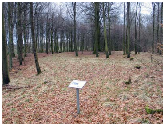
Ringvoldsanlægget Trælborg ved Veerst.

let igen før Ribe amt nåede at blive nyberejst. Amterne fik uddelegeret ansvaret for både tilsyn og pleje med de fredede fortidsminder, men af forskellige årsager blev en egentlig nyberejsning aldrig gennemført.