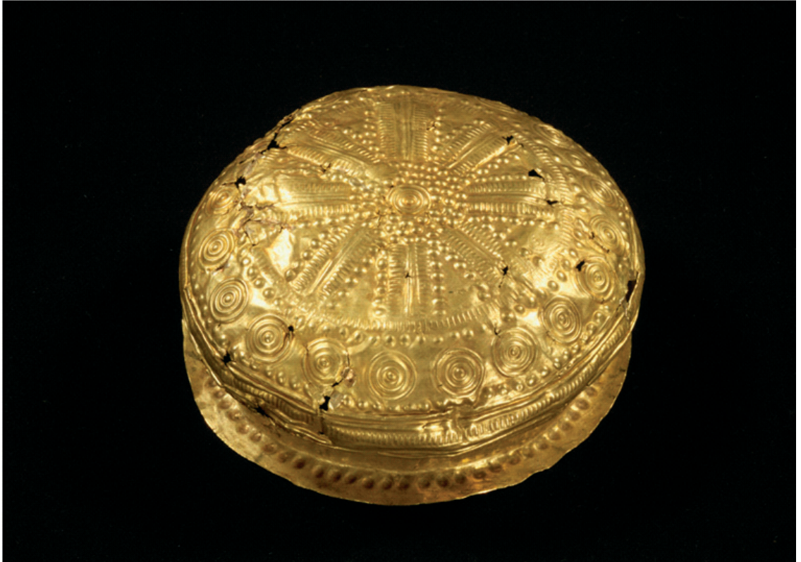
Guldkarret fra Gjerndrup med dets sirligt udformede cirkelmønstre og geometriske former. Karret var oprindeligt ét af tre, men to forsvandt på mystisk vis. Bemærk solmotivet som udgår fra bundens centrale punkt.

de var endt i Hamborg. Den tredje skål blev sidenhen udstillet på Museet for Nordiske Oldsager og kan i dag ses på Nationalmuseet.