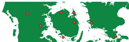
Fund af guldsåle i Danmark.

Skålene stammer formentlig fra Nordtyskland eller Frankrig, hvor de også er kendt. Selvom sålene fra Gjerndrup ikke havde hank, er det et særligt træk, der kendes fra de danske fund. Hankene er hestehovedformede, og består af en tyk bronzestang med omviklet guldtråd. Den er nittet på sålen, uden hensyntagen til mønsteret. På nogle af sålene er hankene brudt af igen, inden de er lagt i jorden.