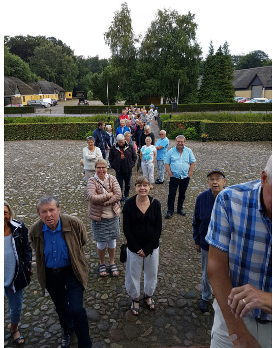
Figur 2. Køen foran Sønderskov, da dørene åbnedes på sidste åbningsdag af guldudstillingen. Et typisk billede for de 18 udstillingsdage.

Det er klart, at når der gøres et bemærkelsesværdigt fund, hvortil der oven i købet kan knyttes interessante ord som "skat", "vikinger" og "guld", så er pressens interesse stor. Det hjalp sikkert også, at vi offentliggjorde fundet i sommerens agurketid. Da fundet blev offentliggjort, var medieinteressen derfor intensiv, og nyheden om fundet gik helt bogstaveligt verden rundt. Det skyldes også et særdeles godt samarbejde med Nationalmuseets presseafdeling.