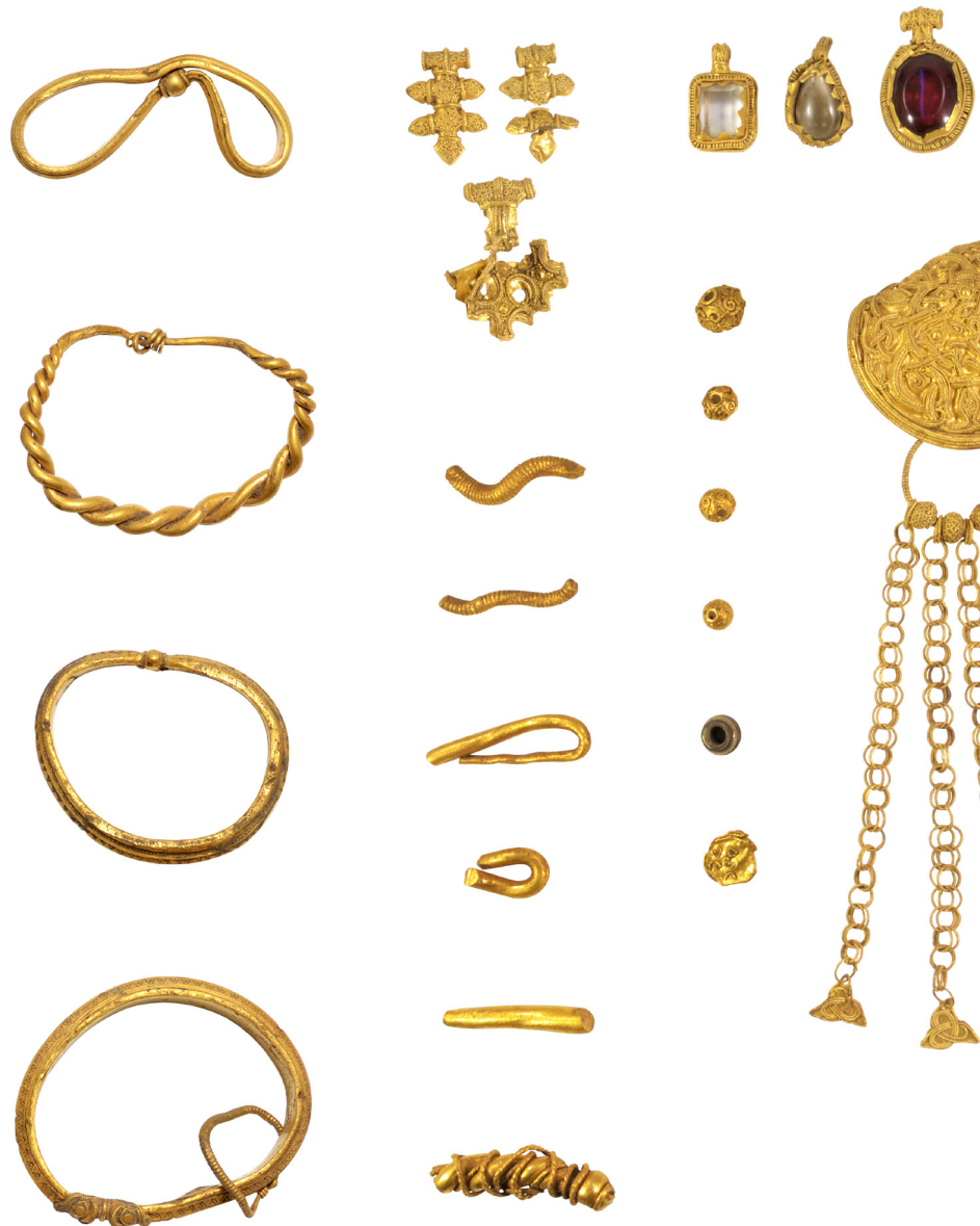
Figur 3. Den samlede skat, som den så ud ved indgangen til 2017. Selvom vi har udgravet hovedparten af skatten, bemærk, at guldkæden fra 1911 mangler i fundet.