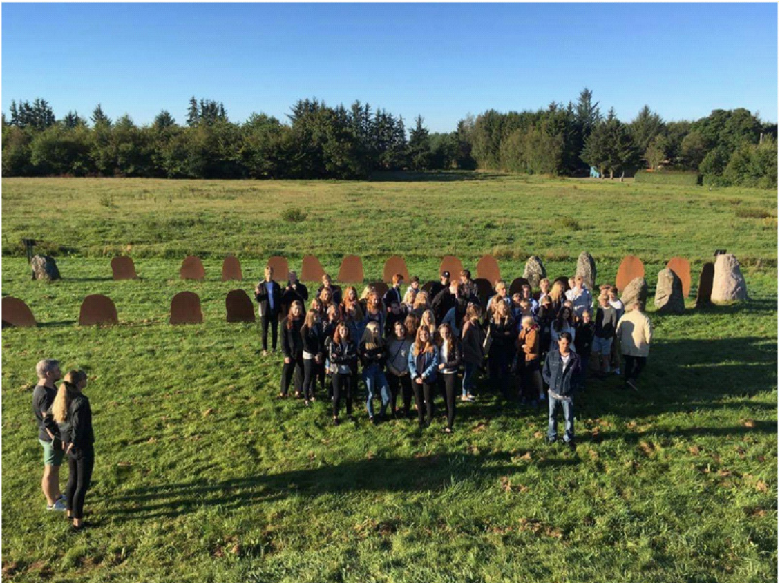
Figur 3. 1.g elever fra Vejen Gymnasium & HF på ekskursion til bl.a. Klebæk Høje.

De afvekslende rum blev en styrke for lærerne, da de i højere grad kunne adskille grupper og fremlæggelser. Lærerne vurderede elevernes indsigt i stoffet, og museumsinspektøren vurderede graden af inddragelse af genstandene, og hvordan eleverne havde tænkt formidlingen af genstanden og det skriftlige stof.