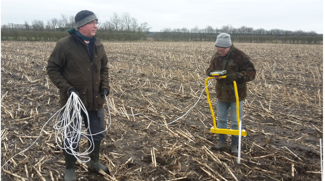
Figur 5. To af de frivillige i gang med modstandmålingen. Den lange ledning, der trækkes efter apparatet, gav uden tvivl alle deltagere et nyt syn på majsmarker.

Resultaterne er vi ved at bearbejde netop nu, og det skulle gerne give os nogle mål at grave efter, når vi har overblikket over pladsen og de hidtidige fund.