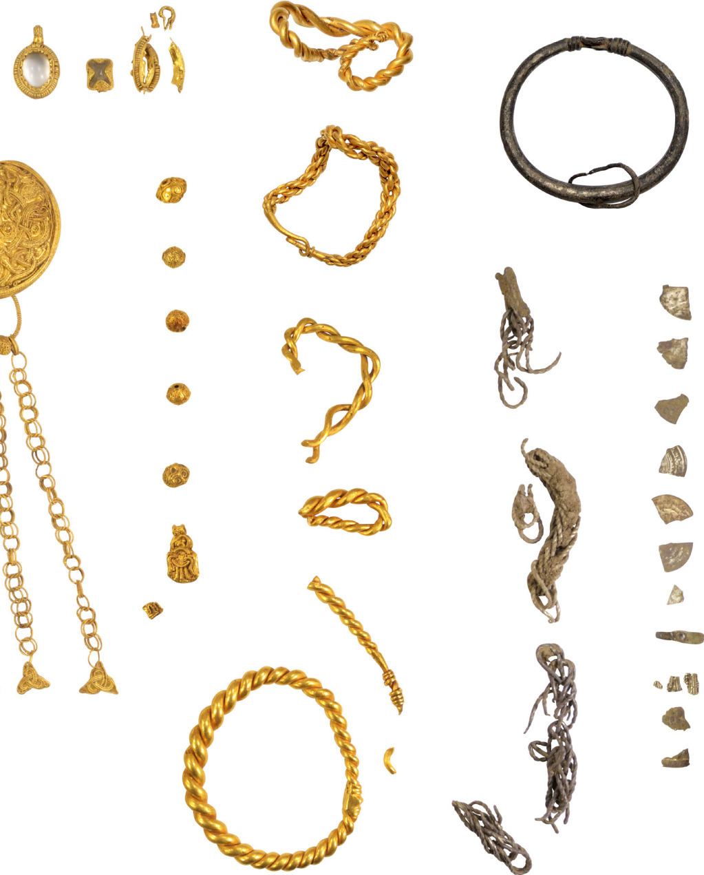
en, vil der utvivlsomt skulle føjes yderligere genstande til dette foto, som er sat sammen af adskillige fundfotos. Schaadt, Museet på Sønderkov, redigeret af Brian Christensen.