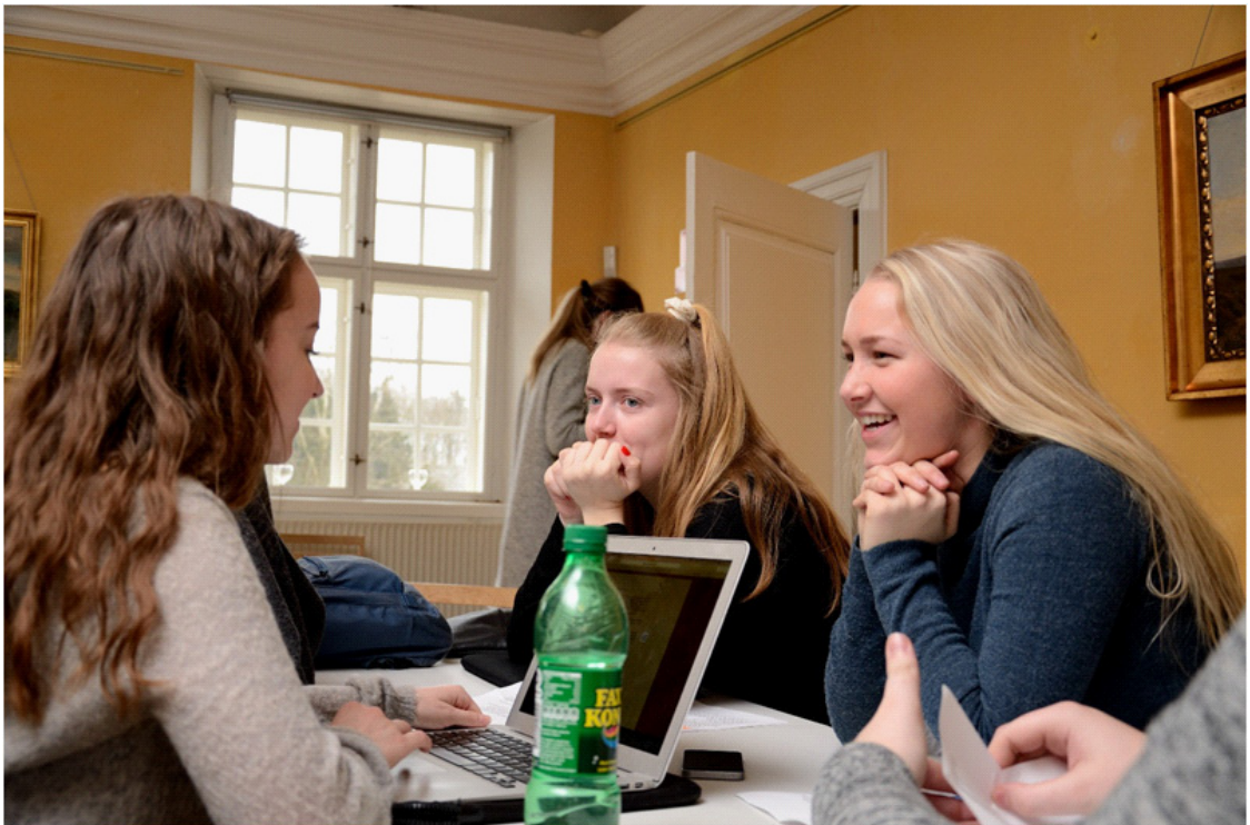
Figur 1. 2.g elever fra Vejen Gymnasium & HF arbejder med Skibelund Krat i museets Riddersal.

afdække muligheder for at sammensmelte gymnasiernes og museernes forskellige fagligheder i endnu højere grad end tidligere set. Samtidig skulle projektet styrke elevernes læring, engagement og motivation gennem brugen af det såkaldte uformelle læringsrum og gæsteundervisning. Antallet af deltagende institutioner gav mulighed for sparring på kryds og tværs, samt sikrede projektet en national spredning og forankring. Projektet blev støttet af Slots- og Kulturstyrelsen. I det