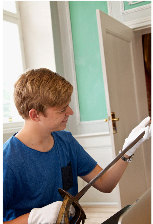
Figur 2. 1.g elev fra Vejen Gymnasium & HF studerer en gammel kårde i forbindelse med den alternative årsprøve.

Lærerne havde valgt emnet, og de udvalgte også det skriftlige kildemateriale. Museets personale fandt en række genstande i museets magasiner, der kunne belyse samme temaer som de udvalgte skriftlige kilder og billeder. Især museets arkæologer var involveret i denne proces, da langt de fleste